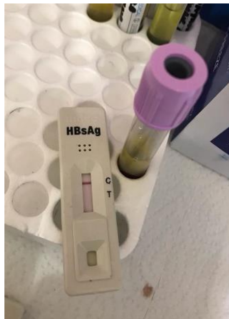
Hasil Pemeriksaan HBsAg pada ibu hamil