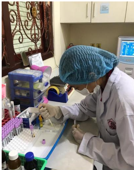
Meneteskan sampel ke sumuran sample reagen