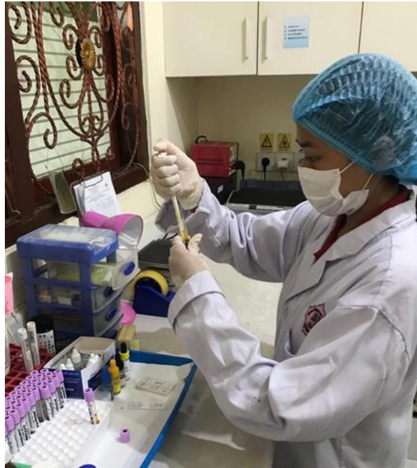
Proses memipet plasma