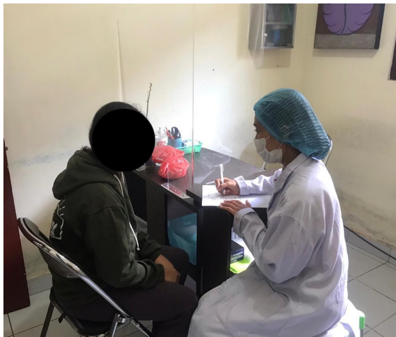
Wawancara pada responden