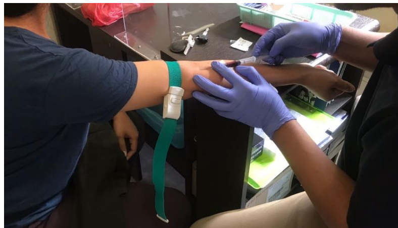
Pengambilan sampel pada responden